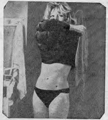
Por donde se mire la respuesta siempre es: "Brigitte". En efecto, una escena de "SOLAMENTE POR AMOR". Eso, la anuncia Miss Bardot en reciente película. No se olviden que para el próximo viernes prometemos: cómo se vería doña Brígida... digamos, un par de minutos después.