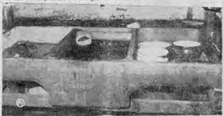
EN ESTA PILA APARECIÓ MUERTA LA NIÑITA. La madre declaró que al encontrarla se llenó de desesperación, pero que pudo notar que el tarro (que aparece flotando bajo el tubo) no había sido dejado allí sino a uno de los lados de la pila.