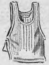
GAMISETAS PARA NIÑOS

En poplín de calidad especial, elegantes y distinguidas en tallas desde el 13½ hasta el 17. PRECIO ESPECIAL EN CANTIDAD LIMITADA