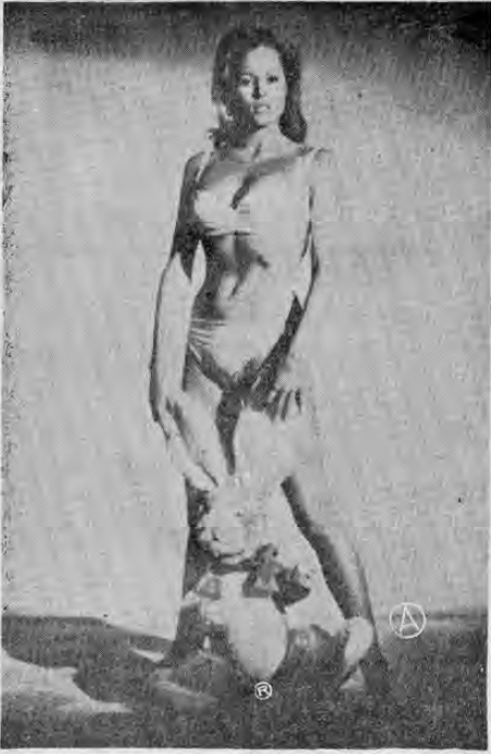
Poca cosa: Ella es Ursula Andres. Llegó el verano, viva la alegría... Ya rompieron los Neretes, y mucho es lo que se rompe "En el Doctor No". Original película donde la inocente Ursula está en primera línea. Nadie dice "no" al "terrible Doctor No". Y menos la niña Ursula...

No piensen los autores de la idea hacer ningún reclamo, naturalmente. Lo único cierto es que en el presente, han decidido de renovar su devoción por el "watusi" y este baile, coincide con el "twist" sigue creciendo en popularidad especialmente en la cosmopolita ciudad portuaria que hoy reclama nada más que la discutida gloria de haber dado al mundo la más alocada fórmula de descomulgarse.