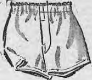
GALZONCILLOS PARA CABALLEROS

En elegante punto de algodón fuertes y resistentes. Tallas surtidas.