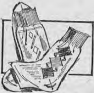
GALCETINES PARA NIÑO

Maravillosa calidad en algodón selecto, con elástico reforzado. Tallas desde el 28 hasta el 42.