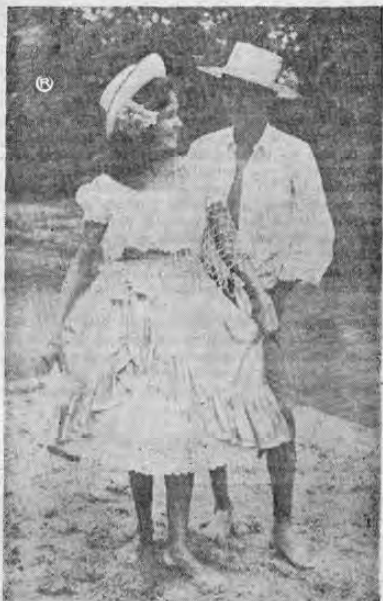
Baile El Cambute:

Este baile costero se originó entre pescadores. Es alegre y romántico, en el cual los amores salpican como las espumas de las repuntas.