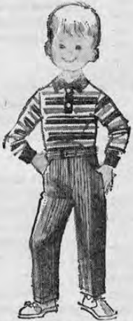
GAMISA POLO PARA NIÑO DESDE

También tenemos un surtido de jackets en nylon, algodón, espuma, etc. para niños de 2 a 6 años.