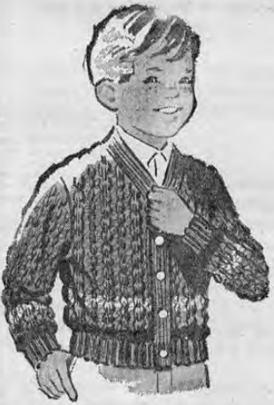
SWEATERS PARA NIÑOS