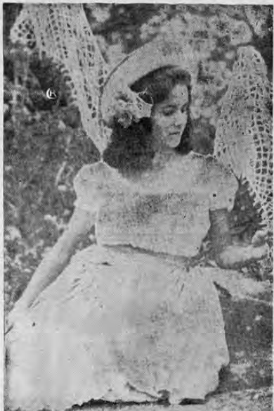
Descripción del traje para el Baile El Cambute:

Suplemento Cinematográfico — Nº 24 — Por ENRIQUE AZOFEIFA V.